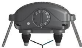
Posturi de contact

Selecționați posturile de contact care oferă contactul optim al pielii.